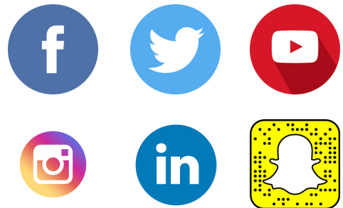
De gauche à droite : Facebook, Twitter, Youtube, Instagram, LinkedIn, Snapchat

Un an après le lancement de Myspace, un étudiant d'Harvard met en ligne un trombinoscope des étudiants de son université. Les utilisateurs du service peuvent également publier des photos et échanger entre eux : « Facebook » fait ses premiers pas. Deux ans plus tard, le site devient accessible à tous et connaît un succès fulgurant.